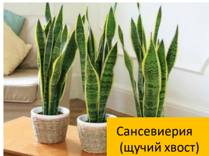
Сансевиерия (щучий хвост)